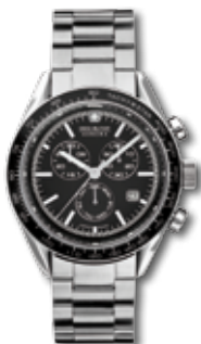
SM11884JSN.HO2M PVP 230 €