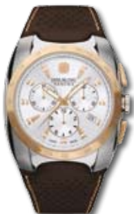
SM10698JSBR.H04RG PVP 230 €