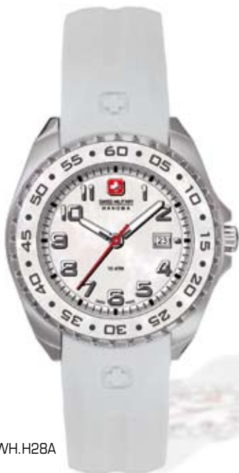
SM12142LSNWH.H28A P.V.P. 140 €