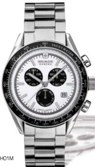
SM11884JSN.HO1M PVP 230 €