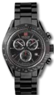
SM11885JSB.HO2M PVP 240 €