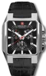
SM10077MSNBK.02 PVP 249 €