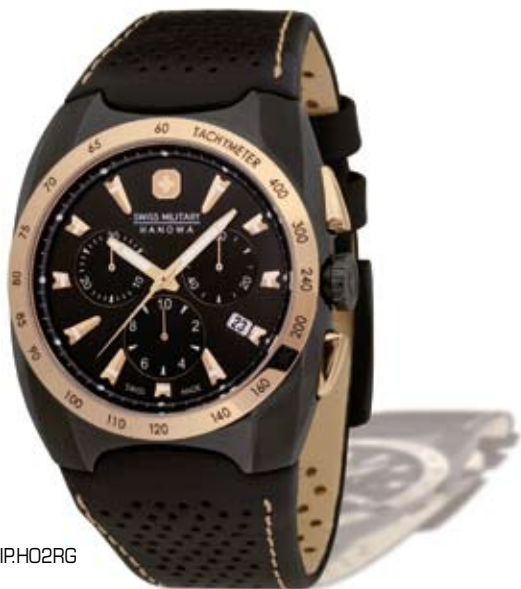
SM10698JSIP.H02RG PVP 240 €