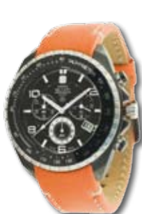
SM11438JSB.02 PVP 220 €