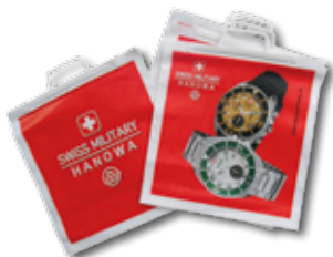
Bolsas corporativas plástico