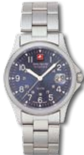
SM1466.03M PVP 100 €