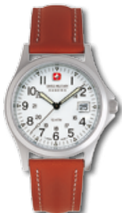
SM1466.01BR PVP 90 €