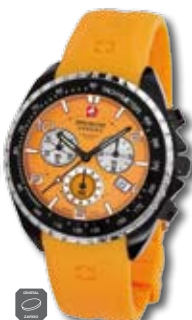
SM11438JSB.H17 PVP 235 €