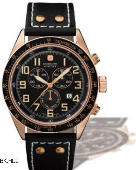
SM11886XSRBK.H02 P.V.P. 240 €