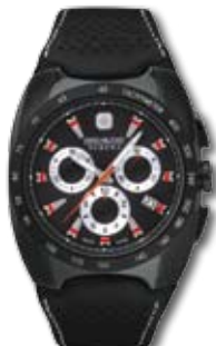
SM10698JSIP.H05A PVP 220 €