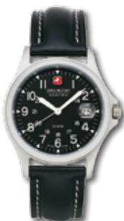
SM1466.02BK PVP 90 €