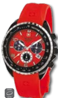
SM11438JSB.H16 PVP 235 €