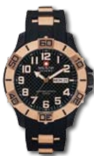
SM14331IP.HO2B PVP 190 €