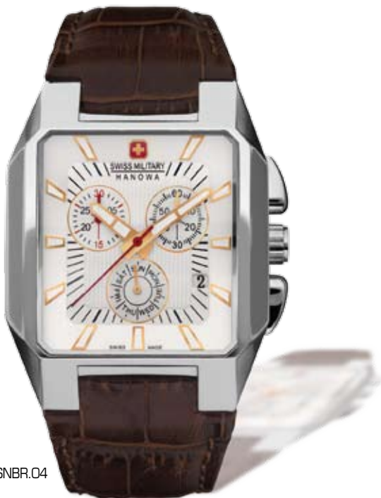
SM10077MSNBR.04 PVP 249 €