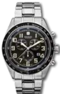
SM11886XSN.H02M PVP 245 €