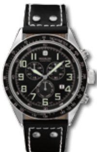
SM11886XS.H02 PVP 230 €