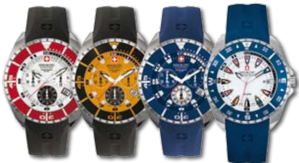
01BK PVP 190 €