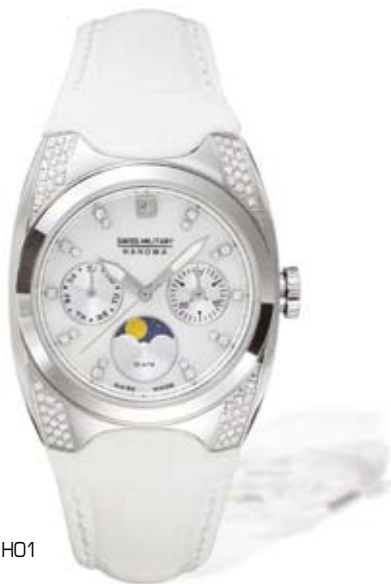
SM11406LSWH.H01 PVP 240 €