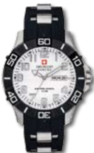
SM14331JS.HO1B PVP 180 €