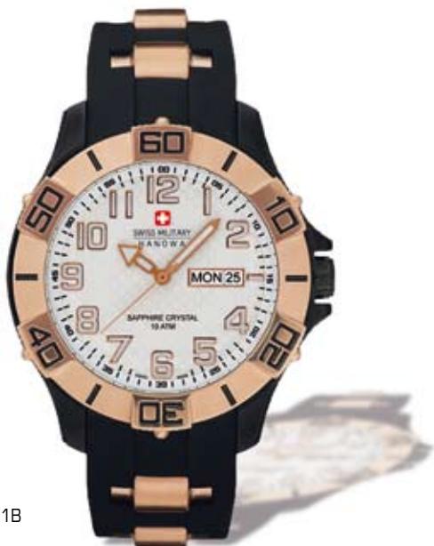
SM14331IP.HO1B P.V.P. 190 €