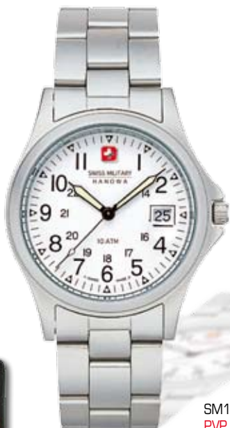
SM1466.01M PVP 100 €