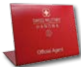
Placa de Agencia Oficial