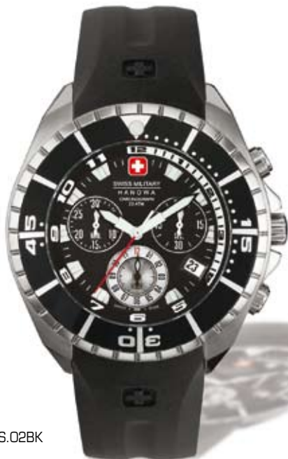
SM10904MS.02BK P.V.P. 190 €