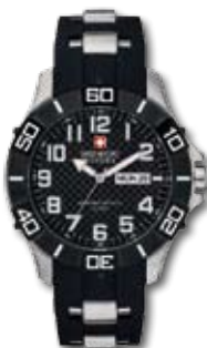
SM14331JS.HO2B PVP 180 €