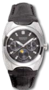
SM11406LSBK.H02 PVP 240 €