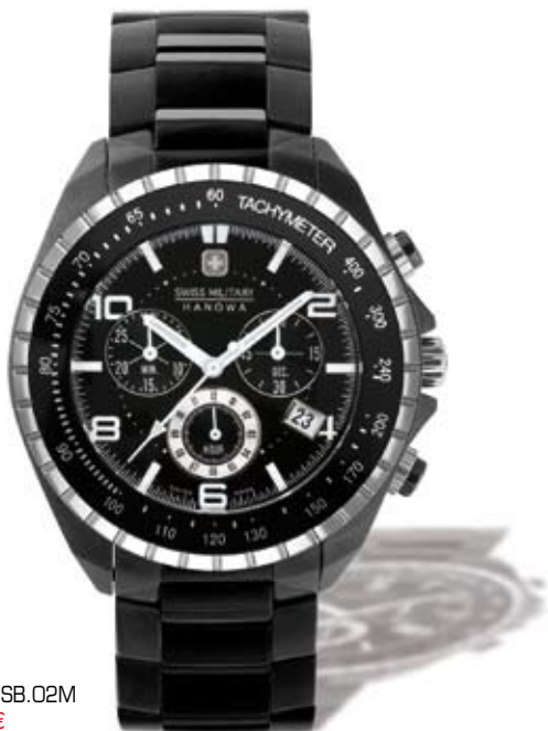
SM11438JSB.02M P.V.P. 240 €