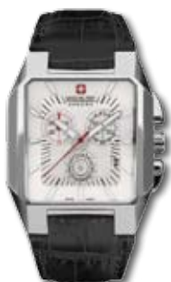
SM10077MSNBK.04 PVP 249 €