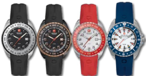
12142LSTBBK.H02 PVP 140 €